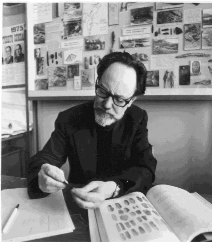
Рисунок 1. Член-корреспондент АН СССР Николай Николаевич Диков в своем рабочем кабинете. СВКНИИ. Вторая половина 1980-х гг.

поприще неоднократно отмечались государственными наградами, среди которых ордена "Знак Почета" и Трудового Красного Знамени. С 2000 года на базе СВКНИИ регулярно проводится региональная научно-практическая конференция "Диковские чтения", издаются ее материалы (в 2018 году состоялась юбилейная X сессия).